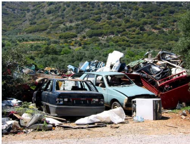
Die Abbildungen zeigen "Autoschrott"-Plätze im (Natur)Schutzgebiet Analipsi (links) und (rechts) bei Drassi (Nordkreta); Öl, Benzin und Kühlflüssigkeit etc. können ungehindert in den Boden – und schädigend ins Grundwasser gelangen! Fotos: H. Eikamp (2003/2004)

"Alles, was nicht mehr zu reparieren ist, bleibt in der "Botanik" stehen, und man überlässt es den Naturgewalten, sich um das Restliche zu kümmern. Die EU-Altautoverordnung ist auf Kreta leider noch ein Fremdwort". – So ein Beitrag im kreta-umweltforum . Hier ist auch ein Beitrag von Greenpeace nachzulesen: "die Koupoupitos-Schlucht auf Kreta, nur 200 m vom Meer entfernt, dient Militärbasen, Krankenhäusern und Industriekonzernen als billige Adresse, um ihren Giftmüll zu entsorgen. Diese illegale Praxis gefährdet Anwohner und Umwelt der Küstenregion gleichermaßen. Trotz eines Urteils des Europäischen Gerichtshofes gegen den griechischen Staat von 1992, diesem Treiben Einhalt zu gebieten, passierte –außer dem beständigen weiteren deponieren von Müll- nichts. Nach 8 Jahren (im Jahre 2000) greift der Europäische Gerichtshof nun erstmals in seiner Geschichte zu drakonischen Maßnahmen. Weil Griechenland das Urteil missachtet, muss das Land ein tägliches Zwangsgeld von rd. 20.000 € bezahlen". Mit dieser Entscheidung wurde Neuland betreten, denn erst seit den seit 1993 in Kraft getretenen Vereinbarungen von Maastricht ist es überhaupt möglich, Sanktionen gegen ein EU-Mitgliedsland auszusprechen. Mit dieser Entscheidung jedenfalls hat der Europäische Gerichtshof ein Exempel statuiert und notorische Umweltsünder werden sich künftig nicht mehr folgenlos hinter der Bürokratie verstecken können.