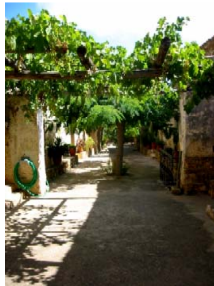
Die Abbildungen zeigen (v. li. n. re.): Den Ausgang zum Konvent des Klosters und einen Blick in die Konventgänge.