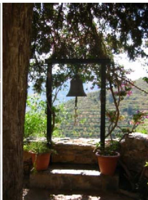
Die Abb. ob. li. zeigt die Kirche des Klosters und die isoliert stehende Kirchenglocke (re.); die Abb. unten den mit Blumen geschmückten Aufgang zum Kloster; Eindrücke aus dem Blumengarten und die Tafel mit den Öffnungszeiten.