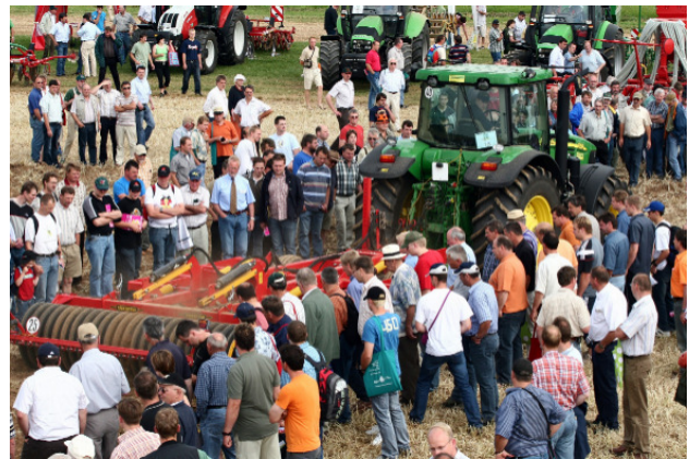
Die Abb. links zeigt eine Teilansicht des DLG-Feldtagegeländes mit Versuchsfeldern und Campuszelten; die Abb. rechts den Bereich der Maschinenvorfürungen im Vorgewende.